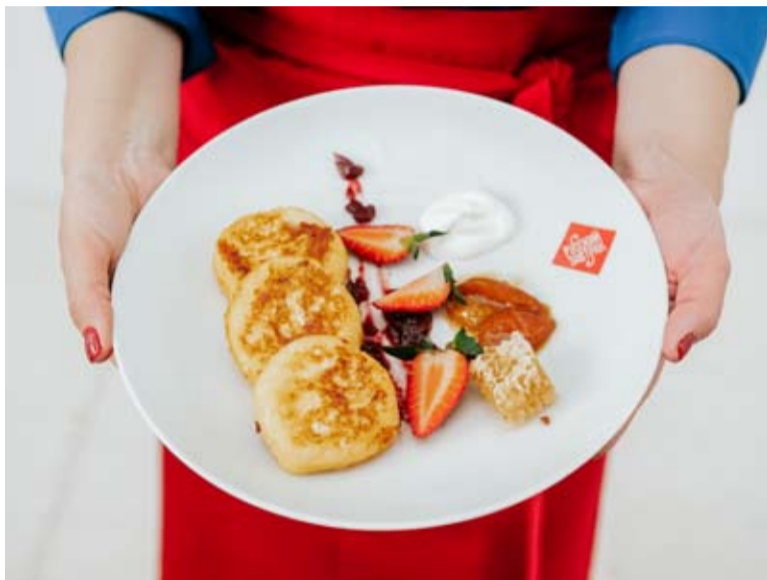
Фото: фестиваль «Русские завтраки»

«Русский завтрак» - первый масштабный культурно-