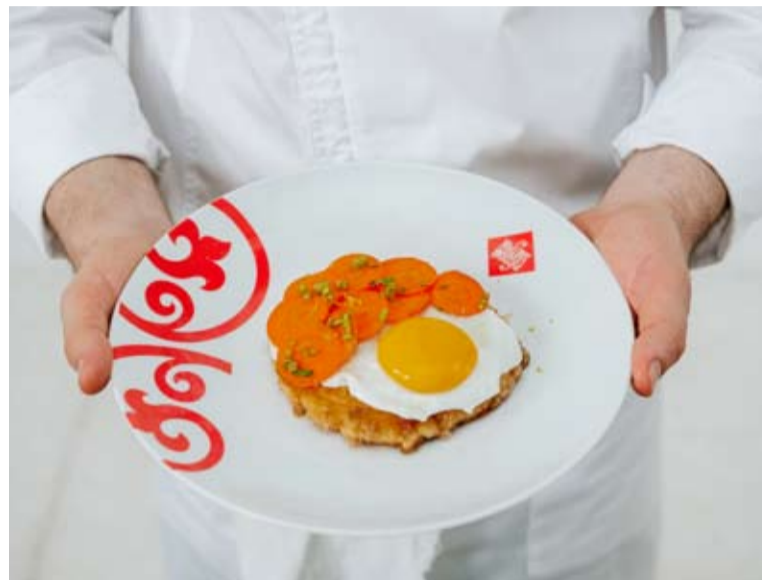
Фото: фестиваль «Русские завтраки»

Первый Всероссийский гастрономический фестиваль «Русский завтрак» стартовал в 2023 году и сразу стал значи-