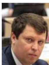
МИХАИЛ МАТВЕЕВ, депутат Государственной думы: