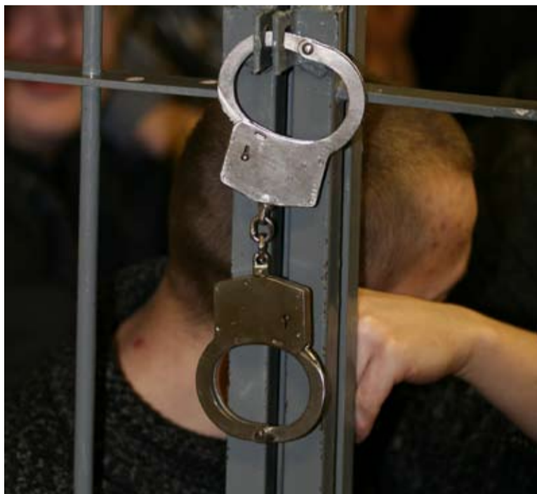
ПРИСМАТРИВАТЬ ЗА «ОБЩАКОМ» и «сидельцами» Зарубинского назначил вор в законе Вячеслав Шестаков (Слива)

Получив указанный статус, он обязывал всех участников